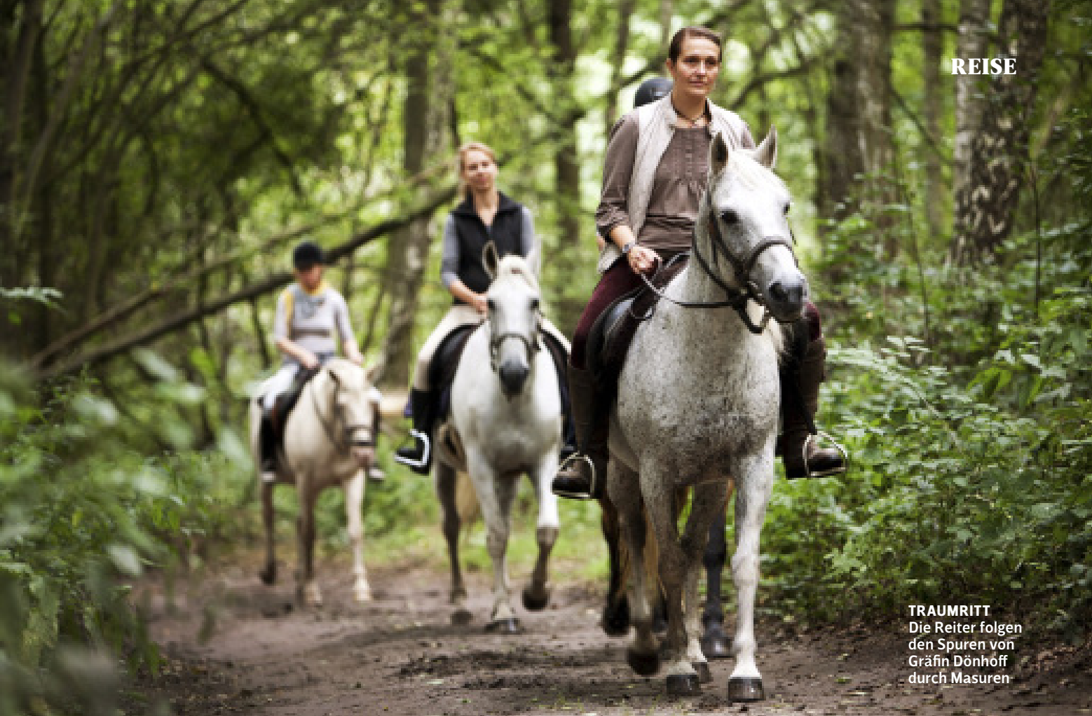
TRAUMRITT Die Reiter folgen den Spuren von Gräfin Dönhoff durch Masuren